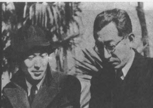
26. Сцена от «Санширо Сугата с Акитеке Коно и РюноскеЦукигата 27. Авторът с режисьора Каджиро Ямамото

27- مع المخرج الياباني «كادجيرو ياماموتور»